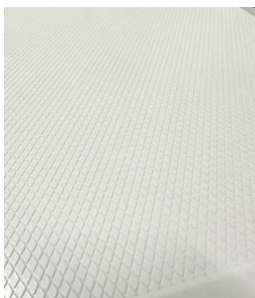
(貼り付け面の凹凸例)